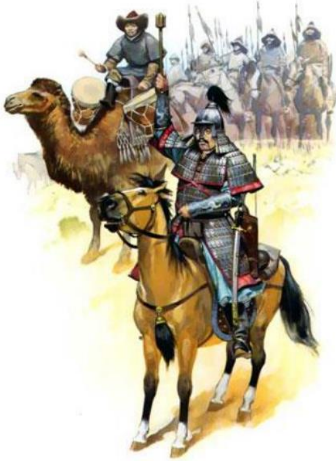
Ress. 1. Cengizli savaşıları