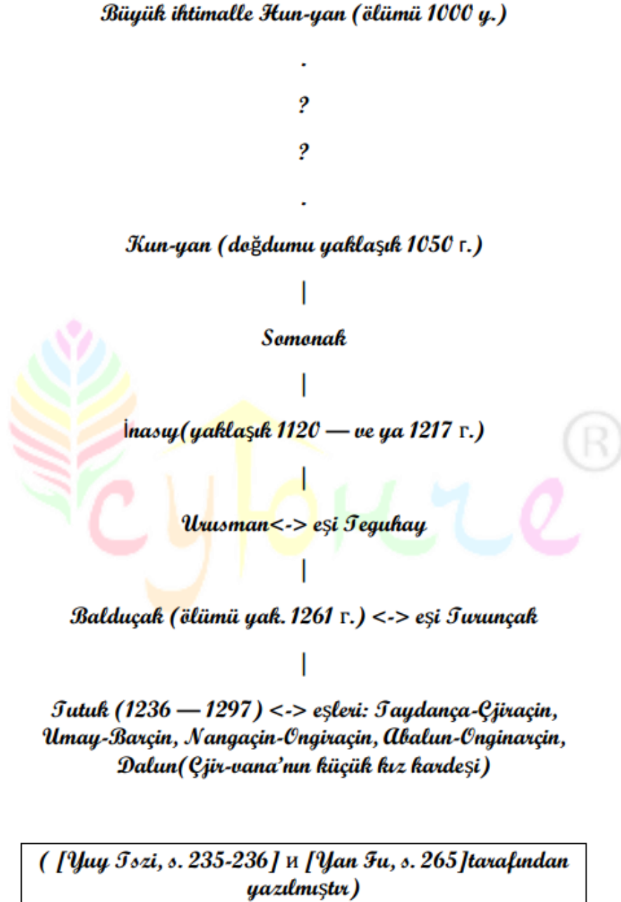
Şema 1 ((Şekil 1)

Aşağıda bunun bir parçasıdır- Tutuk'a kadar (Şekil 1):