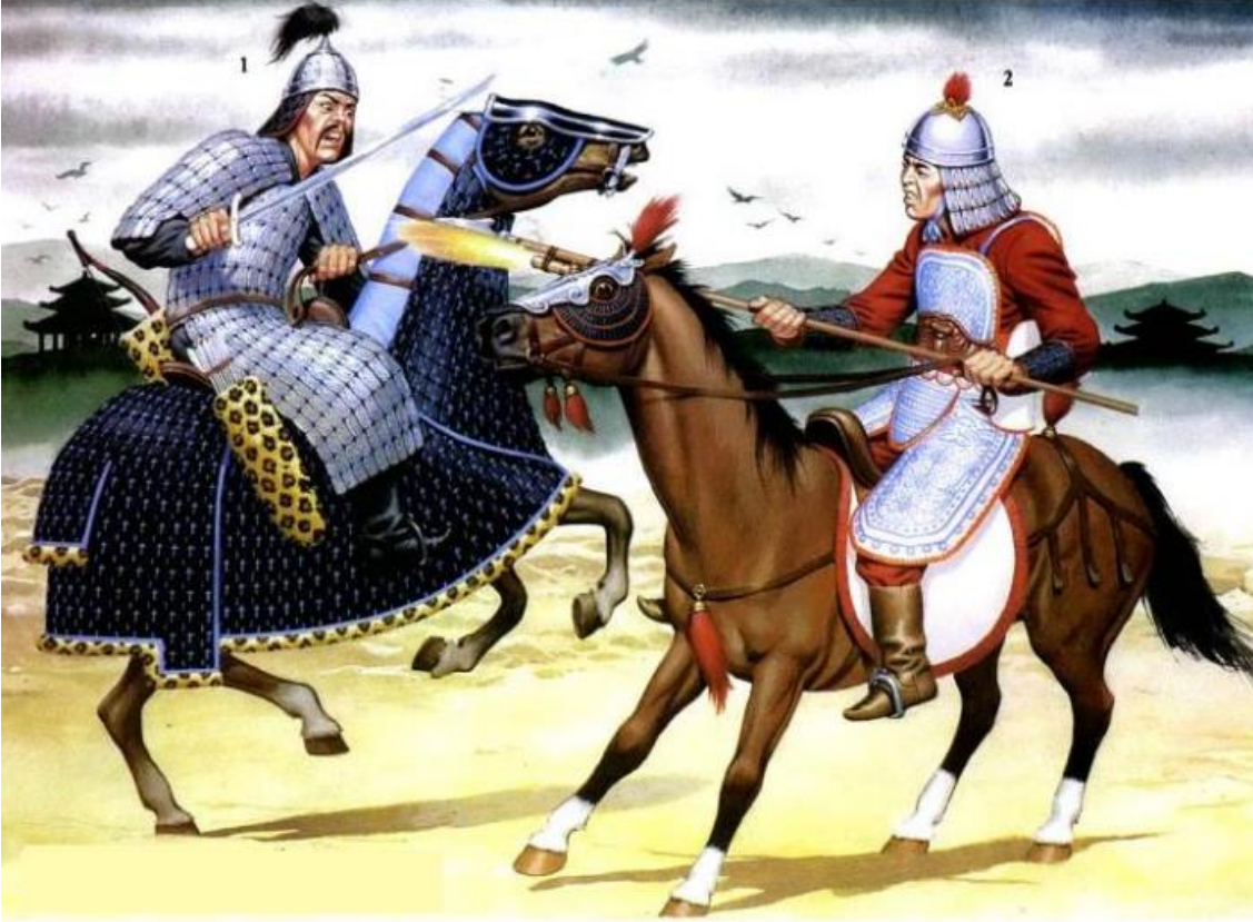
Ress.2. Yuan dönemi süvarisi, yakl. 1260. 1. Ağır silahlı ve atlı Moğol savaşçısı, 2. Atlı çin binicisi

pozisyonları ve yanı sıra Yuan hükümetinde akrabalarının pozisyonları, Tutuk kabilesi 1320 yıllarında İmparatorluğun en etkili kişileri olmuşlar. Özellikle, onlar Yal-Timur döneminde kalkınmışlar, kendisi ise Tok-Temur imparatorun özel dostu olmuş, Yal-Timur aslında XIV yüzyılın 20-lerin sonlarında hanedan mücadelesinde iktidara getirmiş olması.