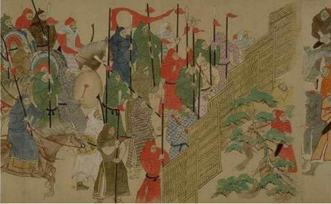
Reprint 1. Moğol savaşçıları «Moğol istilasının kaydıdır». Eski bir XIII yüzyılı freski.***

Bu çalışma, bir anlamda 2013 yılında, yazılmış olan «Volga ve Ural nehir arası bölgelerinde, Tutuk kabilesi (1236-1297yy.) Polovtsi-Hunlar (Çin kaynaklara dayanarak), şeceresini araştırmakta olan – ve o zamanlarda, Hubilay Han'a görevde olan ve onun yanında yüksek sefaya ulaşan Kıpçak'ı anlatan yazılı makalenin devamı ve gelişmesidir.